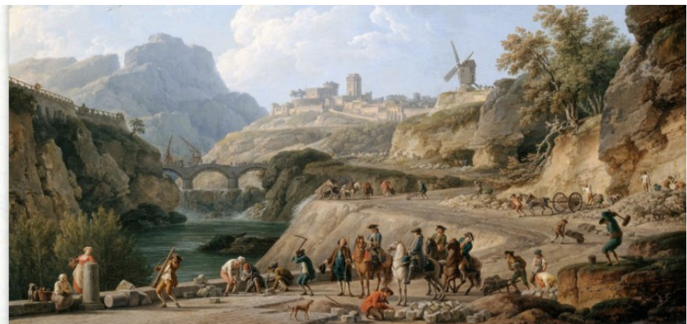
VERNET Joseph, La construction d'un grand chemin, 1774, musée du Louvre

LA ROUTE ROYALE PARIS - LE MANS DANS LE PERCHE