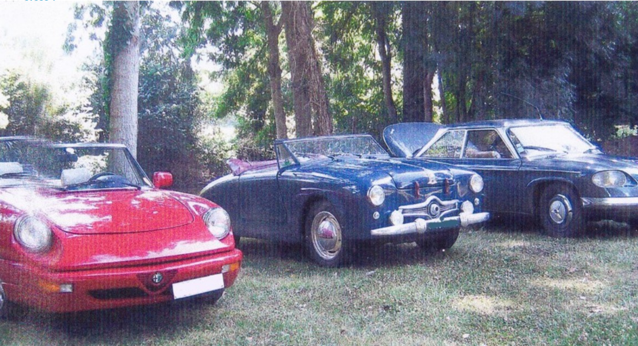
Alfa Roméo Spider 1990